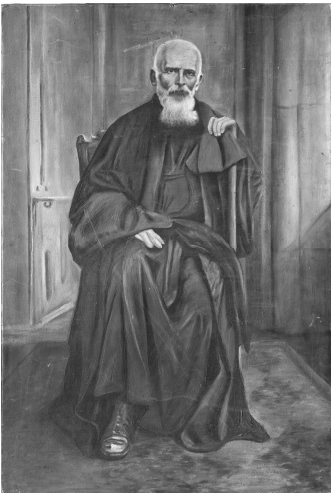
Шалабавка М. Портрет Климентія Шептицького (1938; папір, олія)