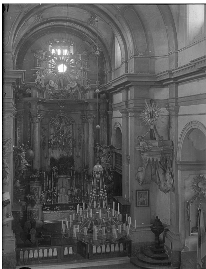
Костел Божого Тіла. Фрагмент інтер'єру