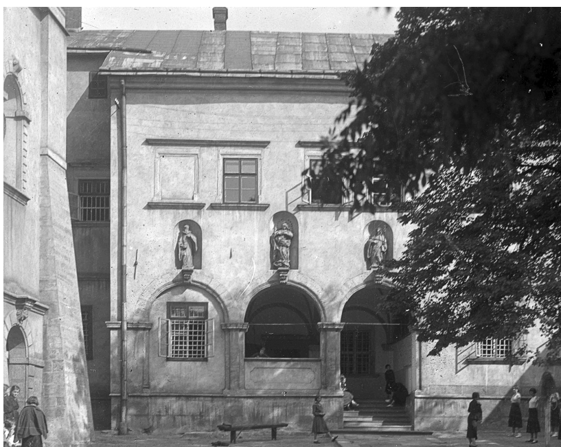
Монастир бенедиктинок. Школа