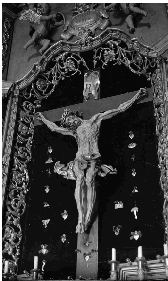
Костел св. Мартина. Розп'яття