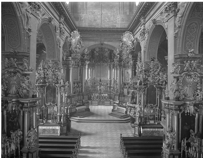
Бернардинський монастир. Інтер'єр