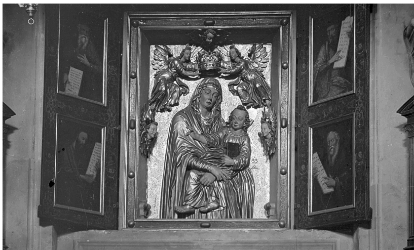
Костел св. Петра і Павла. Богородиця з дитям