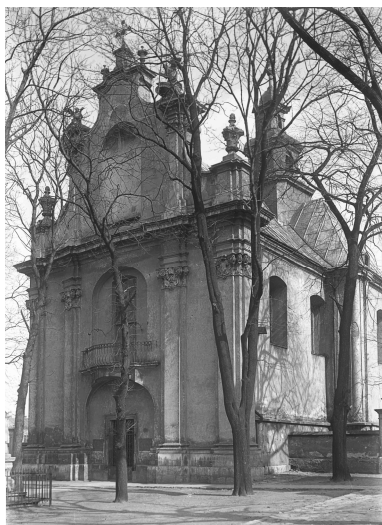
Костел св. Мартина