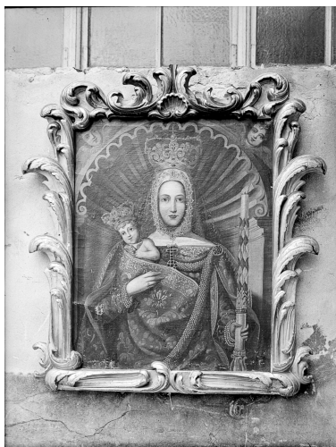
Домініканський монастир. Втрачена ікона Богородиця з дитям