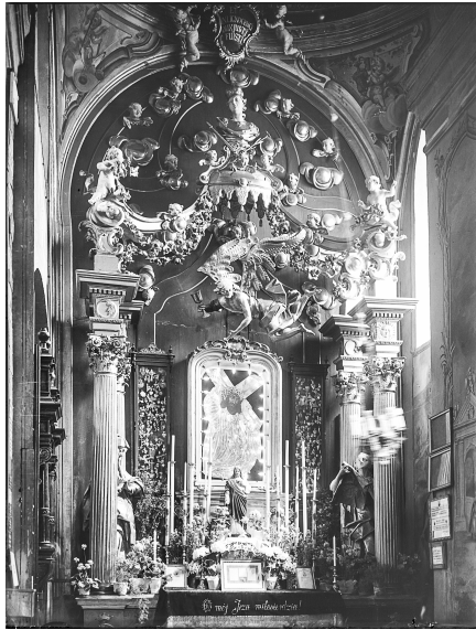
Костел кармелітів босих. Вітнар