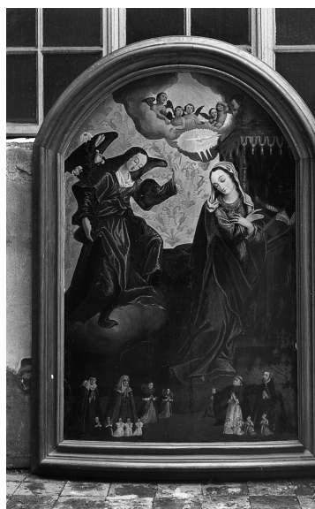
Домініканський монастир. Ікона Благовіщення