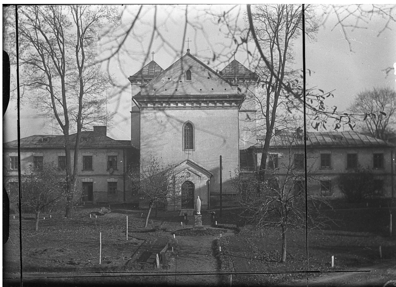
Костел св. Лазаря. Фасад