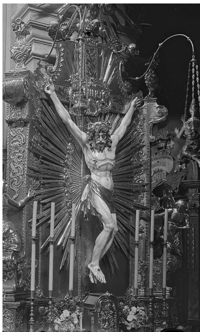
Костел св. Петра і Павла. Розп'яття