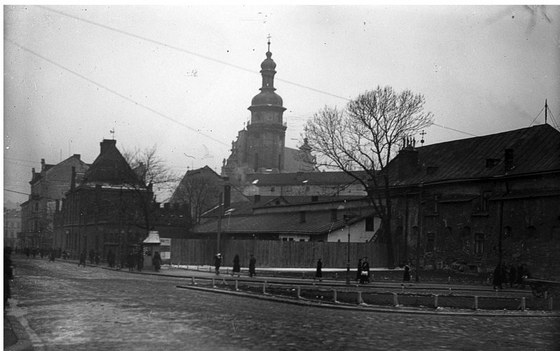
Вид на Бернардинський монастир