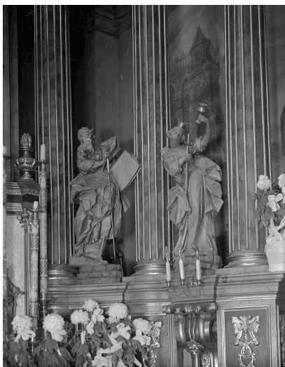
Костел св. Мартина. Фрагмент інтер'єру