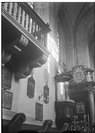
Костел св. Лазаря. Інтер'єр