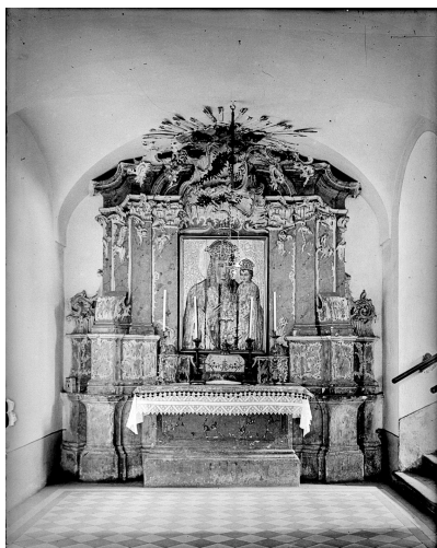
Домініканський монастир. Віттар