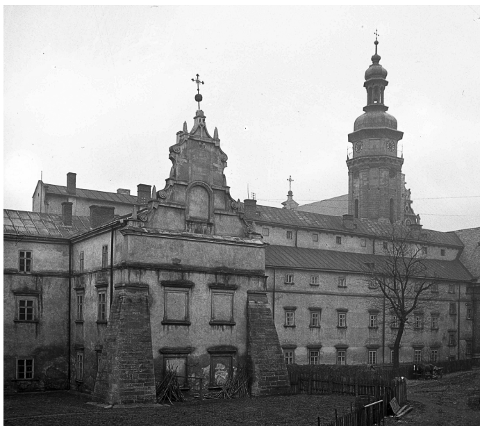
Бернардинський монастир. Вид зі сторони саду