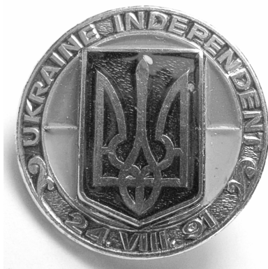
Іл. 10. «Україна незалежна» 1992, Ø 18,5 мм, ФЛР 564

В Україні у перші роки незалежності пам'ятки із зображенням національної символіки виготовляли у видавництві гуманітарної літератури «Абрис». У збірці бібліотеки містяться дві відзнаки цього видавництва з Тризубом та чотири пам'ятки з написом українською або англійською мовами «Україна незалежна» та датою проголошення незалежності «24. VIII. 91» (іл. 10). Багатою на символічний зміст є відзнака 1993 р., виготовлена до 125-річчя «Просвіти»: у центрі пам'ятки зображено розгорнену книгу, над якою сходить сонце, перед книгою у центрі — Тризуб, обабіч якого — колоски (іл. 11).