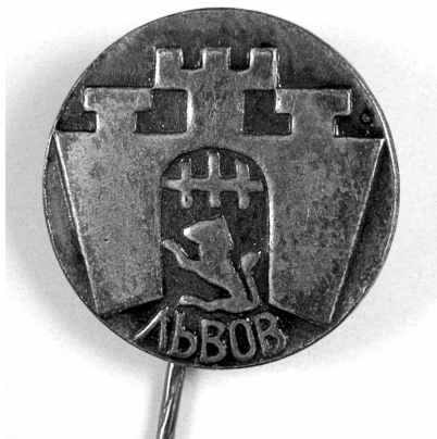
Іл. 2. Відзнака із стилізованим гербом міста Львова [1967], Ø 15 мм, ФЛР 12

Варто зазначити, що у фонді фалеристики є й інші радянські відзнаки 1960-х років, на яких зображено герб Львова без серпа і молота. Одна з них — також металева (але неемальована), виготовлена на тому ж підприємстві, що й синьо-жовто-голуба відзнака (іл. 2). Ще одна — з дерева, виконана технікою випалювання (іл. 3), на звороті містить відбиток із дврядковим написом: «Львівський лісгоспзаг / Ціна 40 коп.».