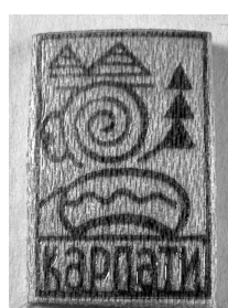
Іл. 7. Туристична відзнака [1972], 19 × 14 мм, ФЛР 252