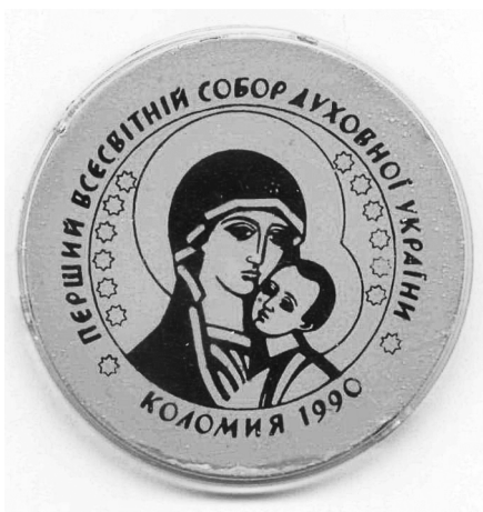
Іл. 8. Пам'ятка Першого всесвітнього собору Духовної України у Коломії 1990 р. Ø 55 мм, ФЛР 556

Особливо вишуканою є пам'ятка Першого всесвітнього собору Духовної України (Коломия, 1990). Відзнака круглої форми, в центрі у колі зображено Богородицю з Дитям та 12 восьмикутних зірок (іл. 8). Гармонійність і висока духовність змісту цієї пам'ятки привертає увагу ще й тим, що її було виготовлено у час, коли ще формально існував СРСР. Цю пам'ятку можна назвати передвісником появи суверенної України та українського духовного відродження.