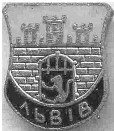
Іл. 1. Відзнака з гербом міста Львова [1967], 17 × 15 мм, ФЛР 7

Відомий дослідник української фалеристики Степан Пахолко згадує, що у роки його молодості така металева відзнака справді була популярна серед студентів, хоча дістати її було складно. Нагадаємо, що йдеться про 1967 р., коли вже затвердили радянський герб міста, а будь-яка антикомуністична пропаганда вважалася злочином. Отож факт використання згаданої фалеристичної пам'ятки у той час можна вважати виявом громадянської сміливості.