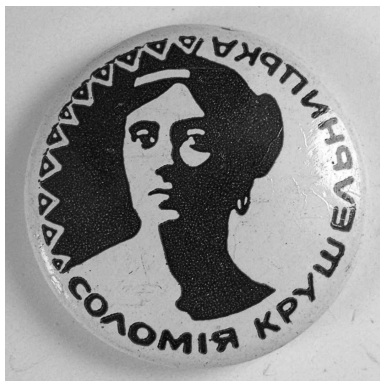
Іл. 4. С. Крушельницька [1972], Ø 23 мм, ФЛР 114

Т. Шевченка, С. Крушельницької (іл. 4), Г. Сковороди (іл. 5). Водночас варто зазначити, що радянська фалеристика у цьому аспекті не була винятковою. Так, українських діячів культури було вшановано й у фалеристичних пам'ятках української діаспори [1, с. 720-721].