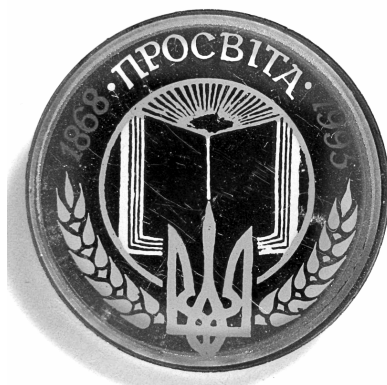
Іл. 11. До 125-річчя «Просвіти» [1993], Ø 23 мм, ФЛР 569