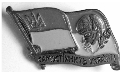
Іл. 9. Відзнака у формі синьо-жовтого прапора з портретом Т. Шевченка [1990–1991], 26×16 мм, ФЛР 558

«САМОСТІЙНІСТЬ УКРАЇНІ!» (іл. 9). Певну допомогу для виготовлення відзнак в Україні у той час надавала українська діаспора, зокрема вона сприяла появі значків із написом «РУХ» [1, с. 713].