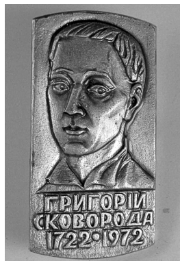
Іл. 5. До 250-ї річниці народження Г. Сковороди [1972], 31 × 16 мм, ФЛР 127

У бібліотеці зберігаються радянські відзнаки, виготовлені для популяризації Карпат та гуцульського етнокультурного регіону (іл. 6, 7). Окремі серії відзнак виготовлялися із зображенням кораблів, літаків та інших транспортних засобів. Поширеними були й дитячі відзнаки, із персонажами казок. Спортивну тематику мають 38 фалеристичних пам'яток, виготовлених у колишньому СРСР, а також три іноземні відзнаки, виготовлені в Німеччині, Польщі та Угорщині.