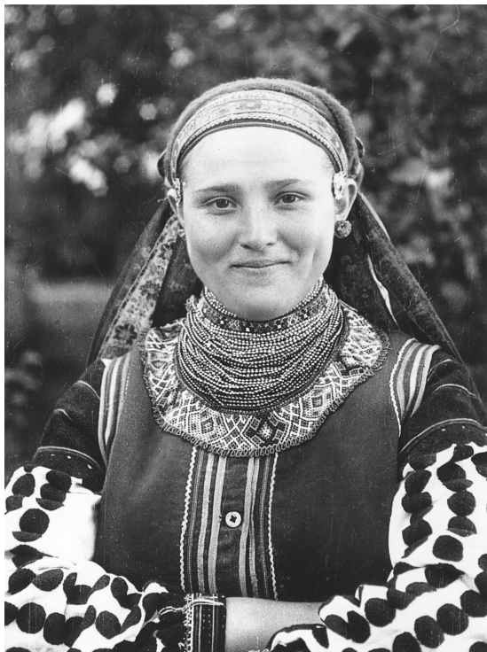
Дівчина-відданиця 15 вересня 1946 р., с. Ясенів-Пільний