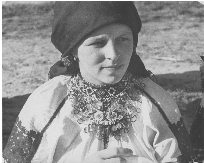
Молода в гердані Червень 1940 р., с. Лука