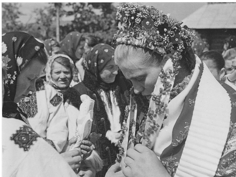
Весільне вбрання молодії. 11 серпня 1960 р., с. Вербовець