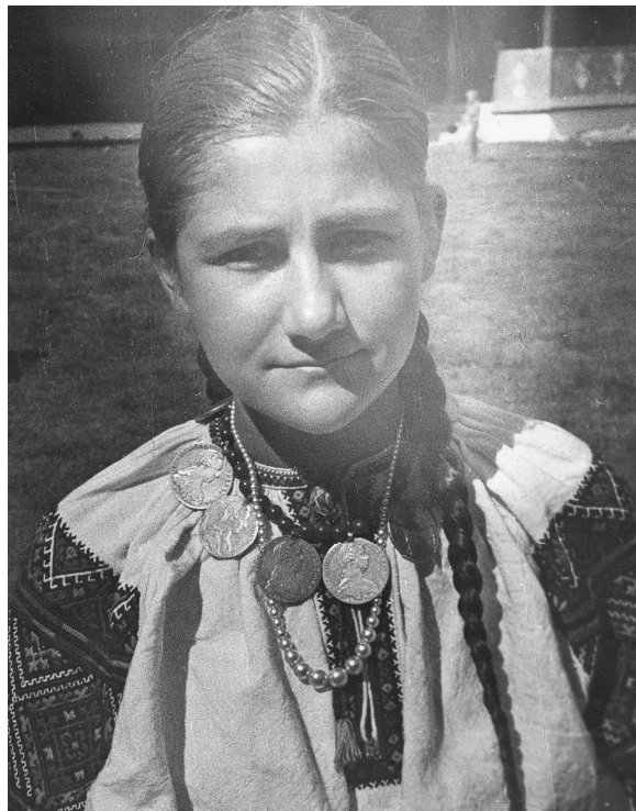
Дівчина з дукачами 12 липня 1971 р., Красноїля