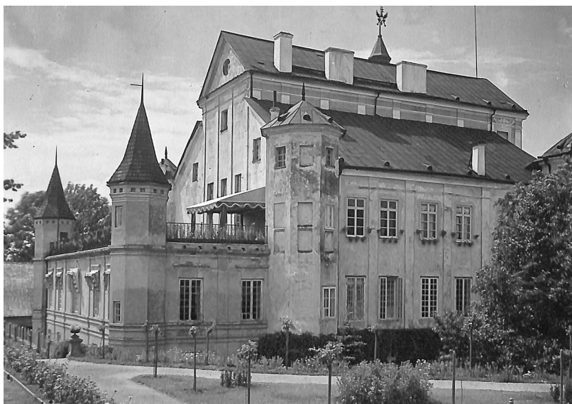
Ян Булгак. Палац Радзівілів. Несвіж (Білорусь), 1918 р.