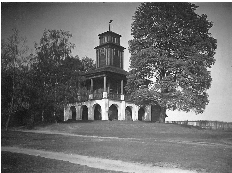
Ян Булгак. Шпихлір. Раудондваріс (Червоний двір, Литва), 1917 р.