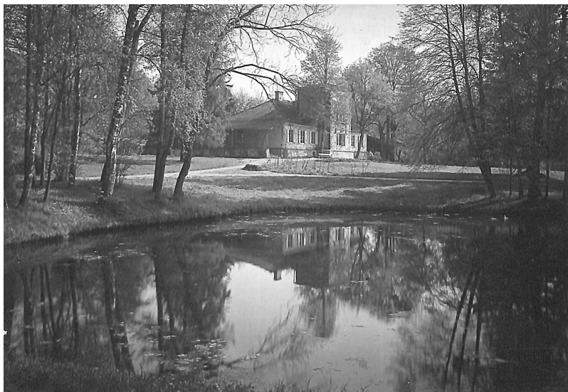
Ян Булгак. Палац у маѣтку Любавас (Литва), 1918 р.