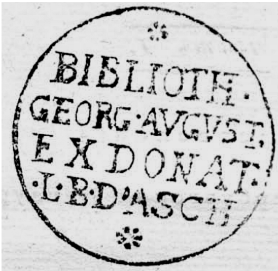
3. Печатка бібліотеки Геттінгенського університету на примірнику «Енеїди» 1798 р. (колекція Аша)