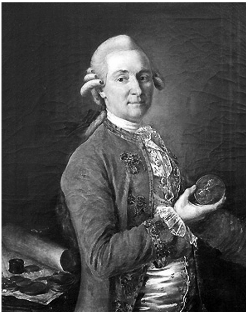
1. Барон Георг Томас фон Аш. Портрет роботи Кирила Головачевського (1780 р.)