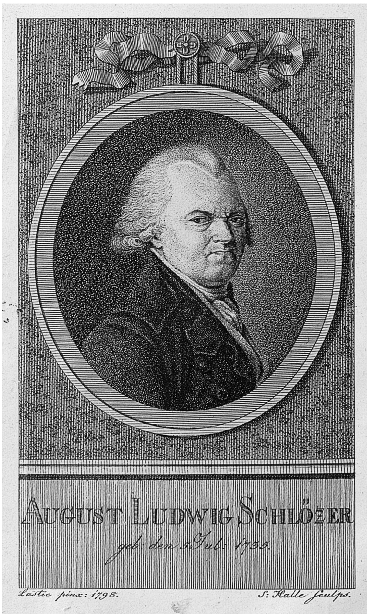
7. Август Людвіг Шльоцер — автор рецензії на «Енеїду» (1798)