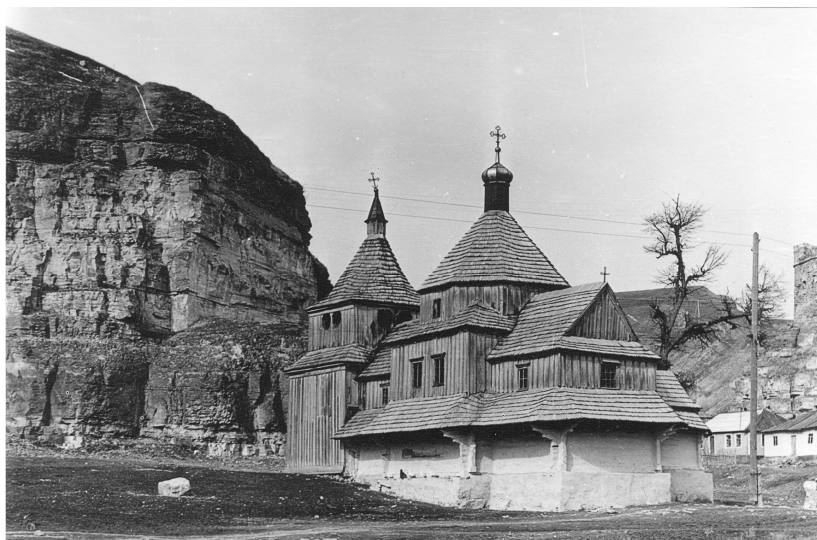
Церква Воздвиження Чесного Хреста на Карвасарах