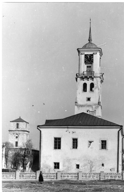
Міська ратуша XIV ст.