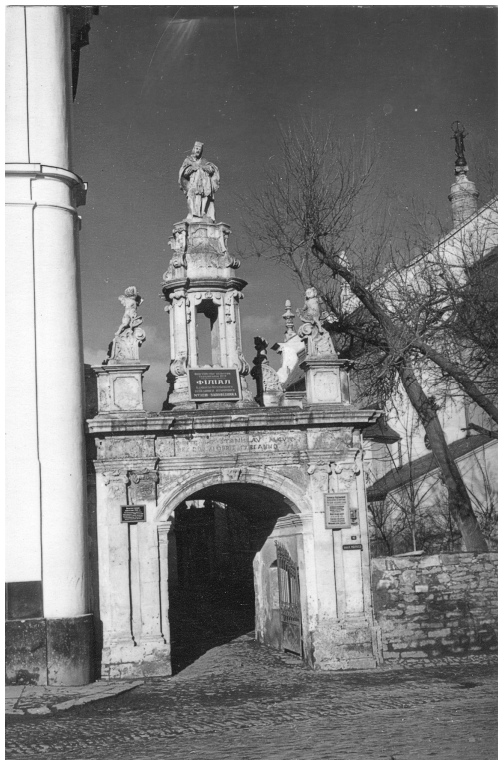
Тріумфальна арка Станіслава Августа