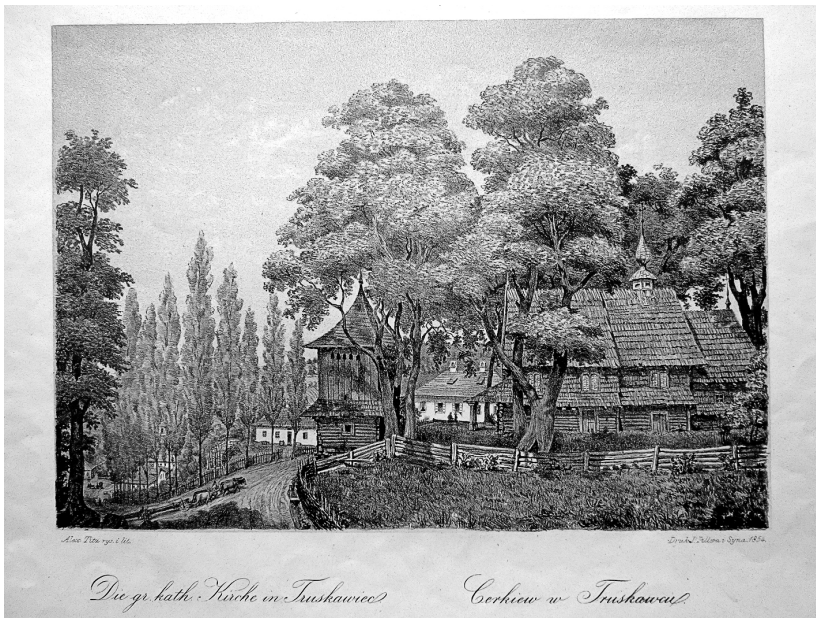
Іл. № 4. Тиц О. Церква Св. Миколи в Трускавці, збудована в XVII ст. Літографія. 1854 р. (Інв. № 84763)