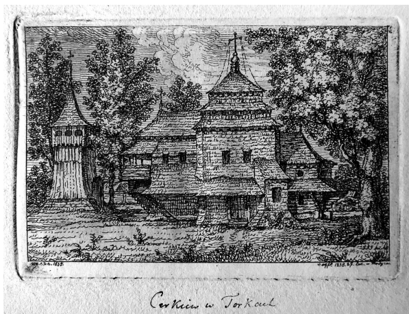
Cerkiew w Torke

Ил. № 2. Келісінський К. В. Церква Успення Пресвятої Богородиці в с. Торки на території Польщі, збудована 1644 р. Гравюра на металі. 1938 р. (Инв. № 8094, 8096, 20750-20753)